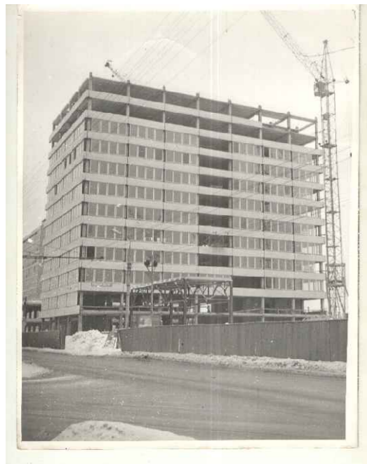
▲ ЗДАНИЕ ВСЕРОССИЙСКОГО НАУЧНО-ИССЛЕДОВАТЕЛЬСКОГО ПРОЕКТНО-КОНСТРУКТОРСКОГО ИНСТИТУТА 1974 ГОДА